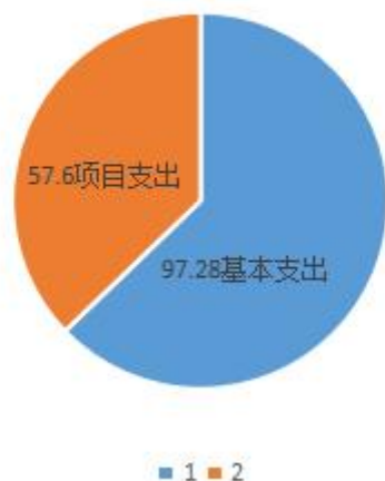
2021年收支情况占比表